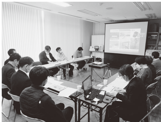
▲活動報告と今年度の計画について説明を受ける委員