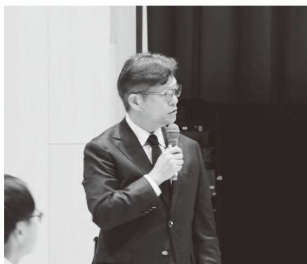
▲「子どもがいいきと成長できる町となれば、保護者もずっと住み続けたい町につながります」と話されました。

運営委員会ではユネスコエコパークにふさわしい自然保護の在り方や、町民の方にも利用しやすい施設運営等についても協議が行われました。